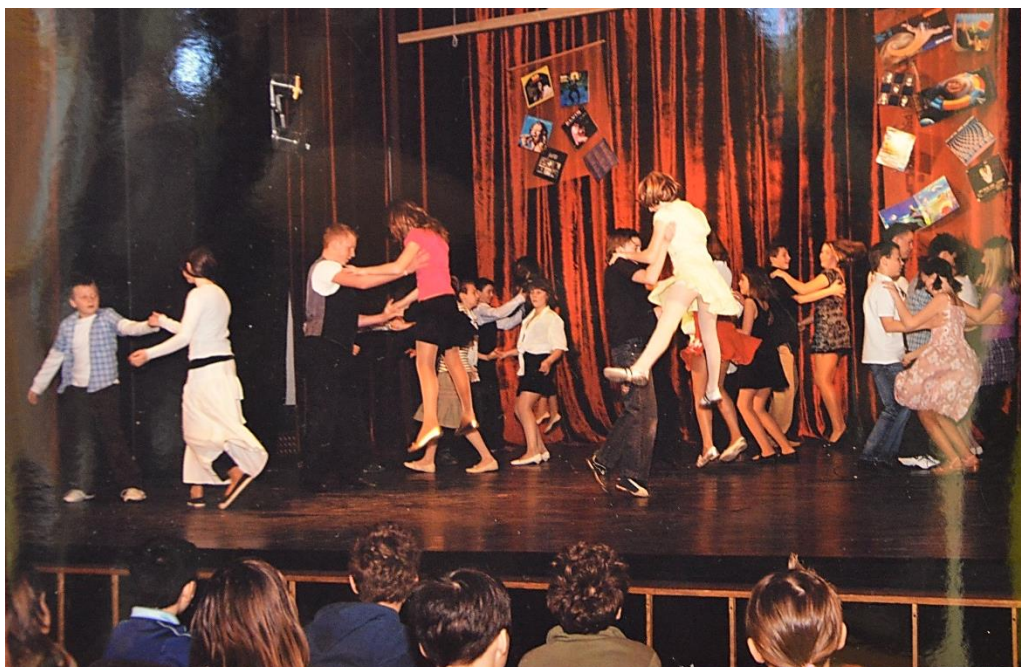
Slika 7: Briljantina