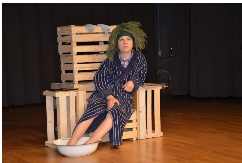
Slika 12: Mali Jezernik in Lovrenčki