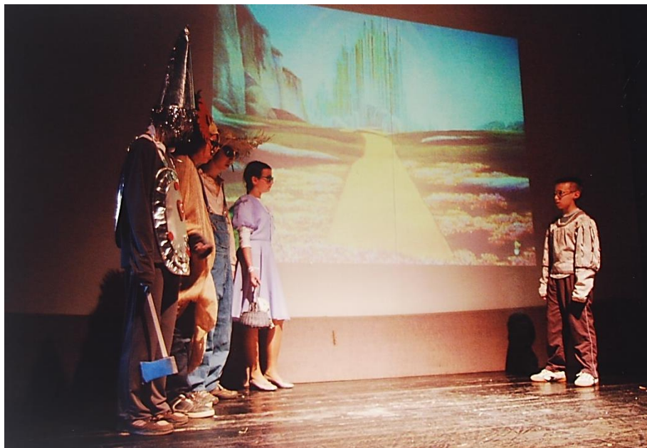
Slika 6: Čarovnik iz Oza