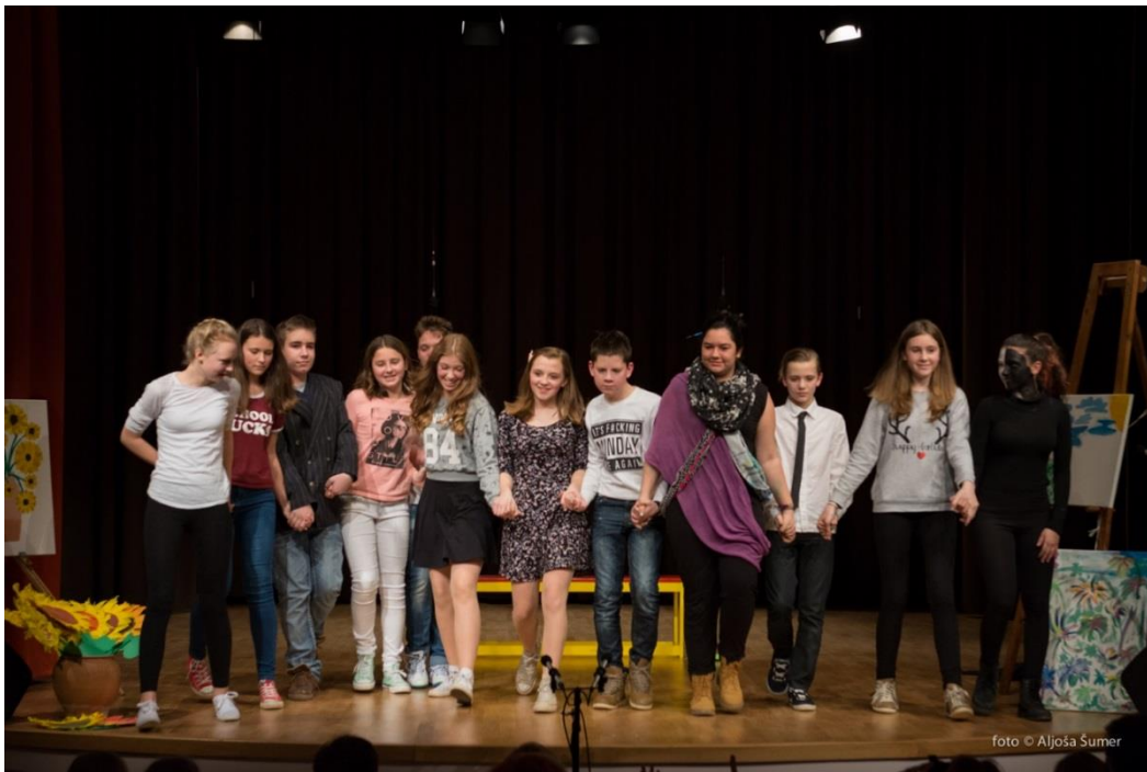
Slika 14: Krastača