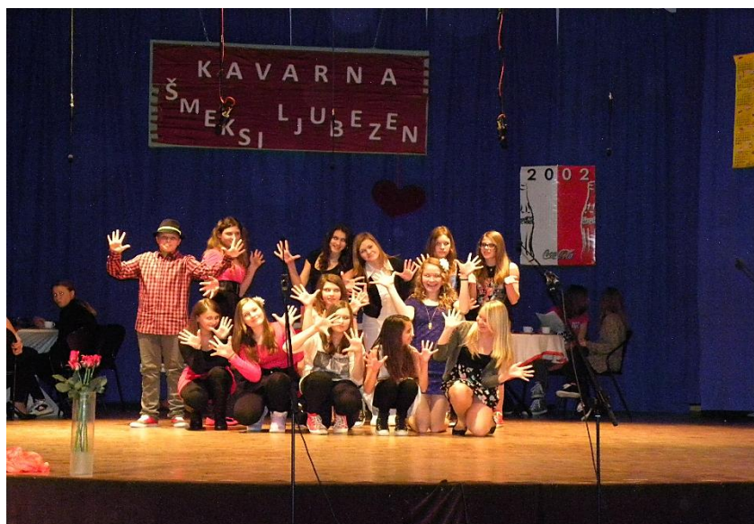
Slika 10: Šmeksi ljubezen