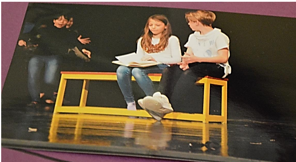
Slika 15: Kaj mi je?