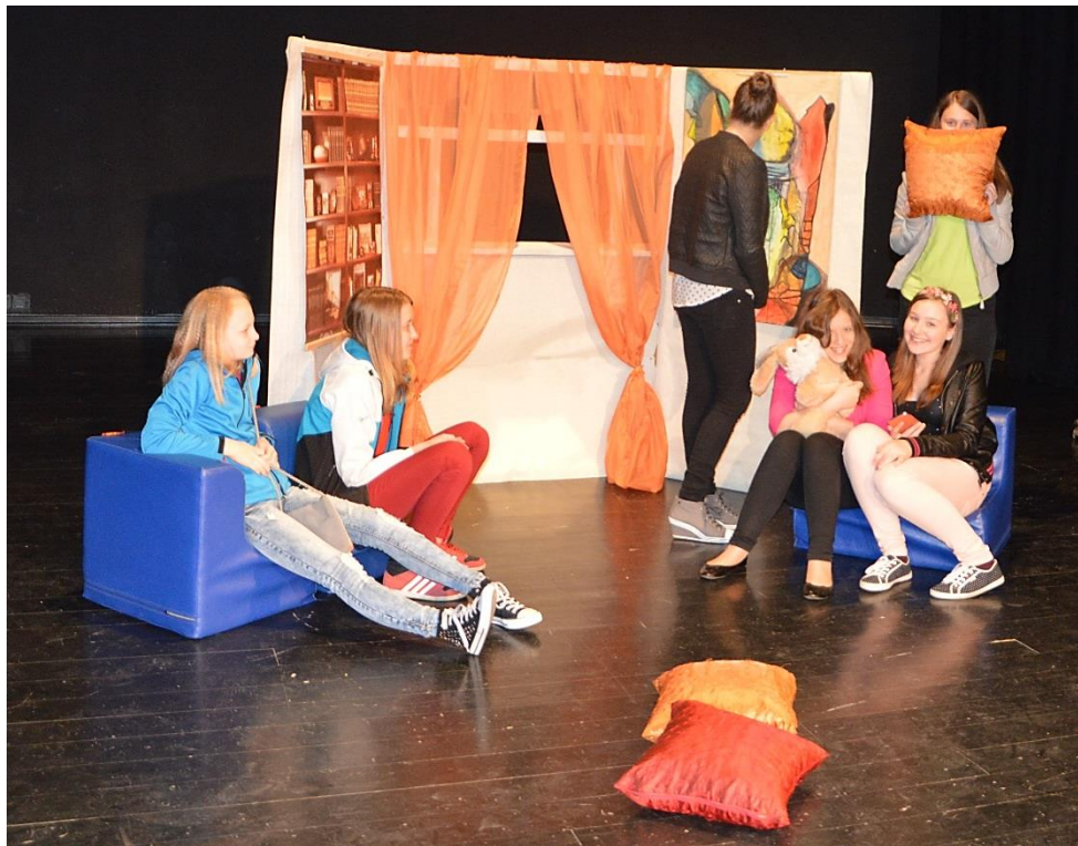
Slika 11: Gospod Volk in kozlički