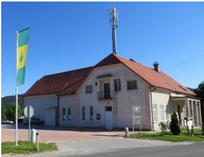
Slika 1: Kulturni dom Jožeta Petruna