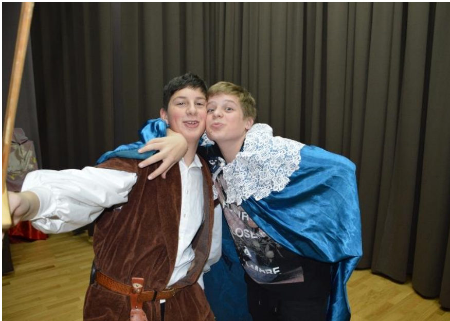
Slika 13: Varuh poslednje vrtnice